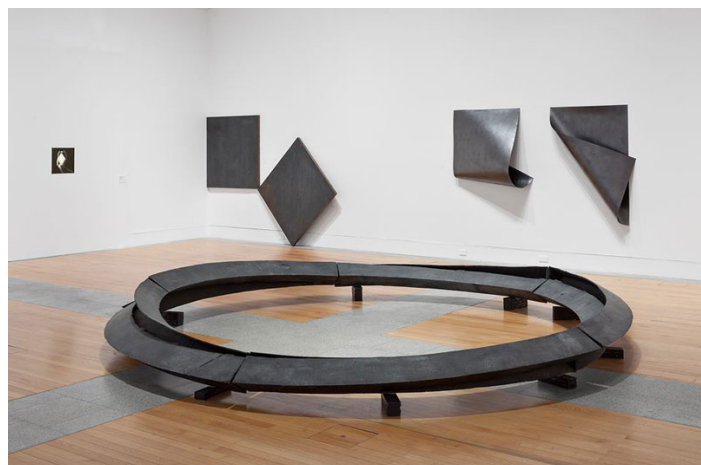
Vista da exposição.