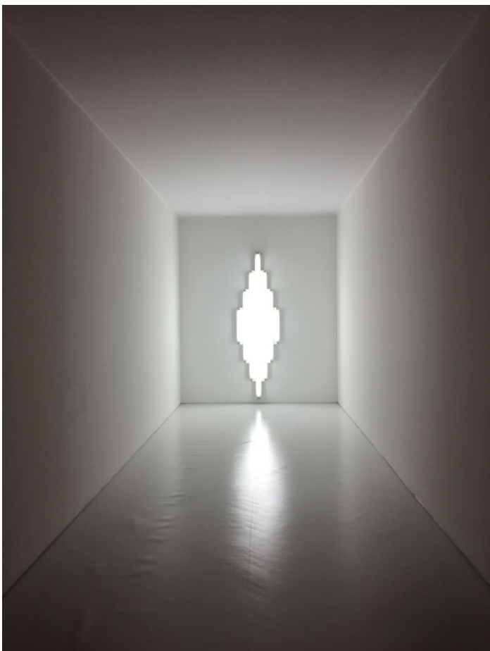
Vista da exposição.