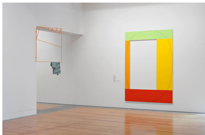
Vista da exposição.