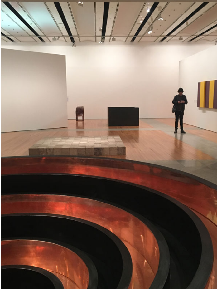
Vista da exposição.