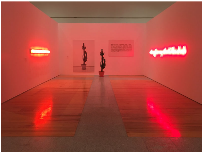
Vista da exposição.