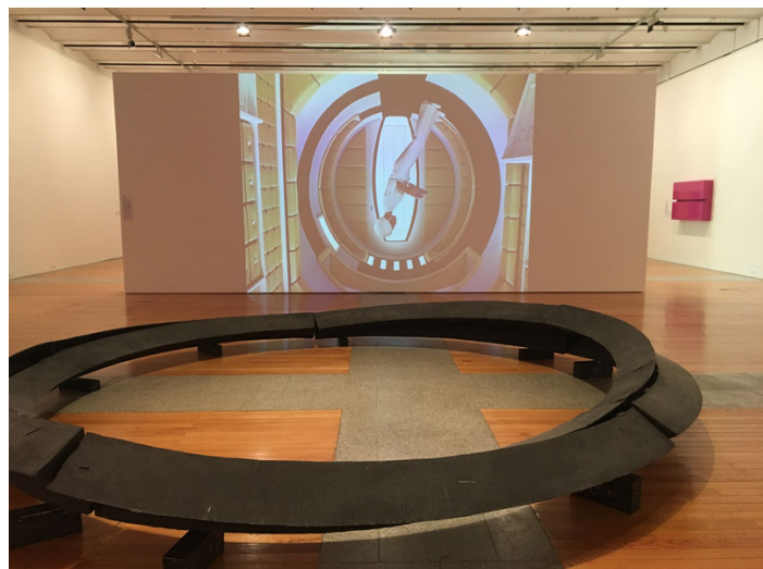
Vista da exposição.