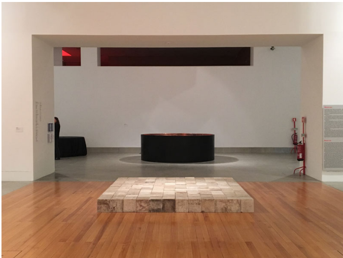
Vista da exposição.